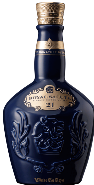
로얄 살루트 21년 500ml